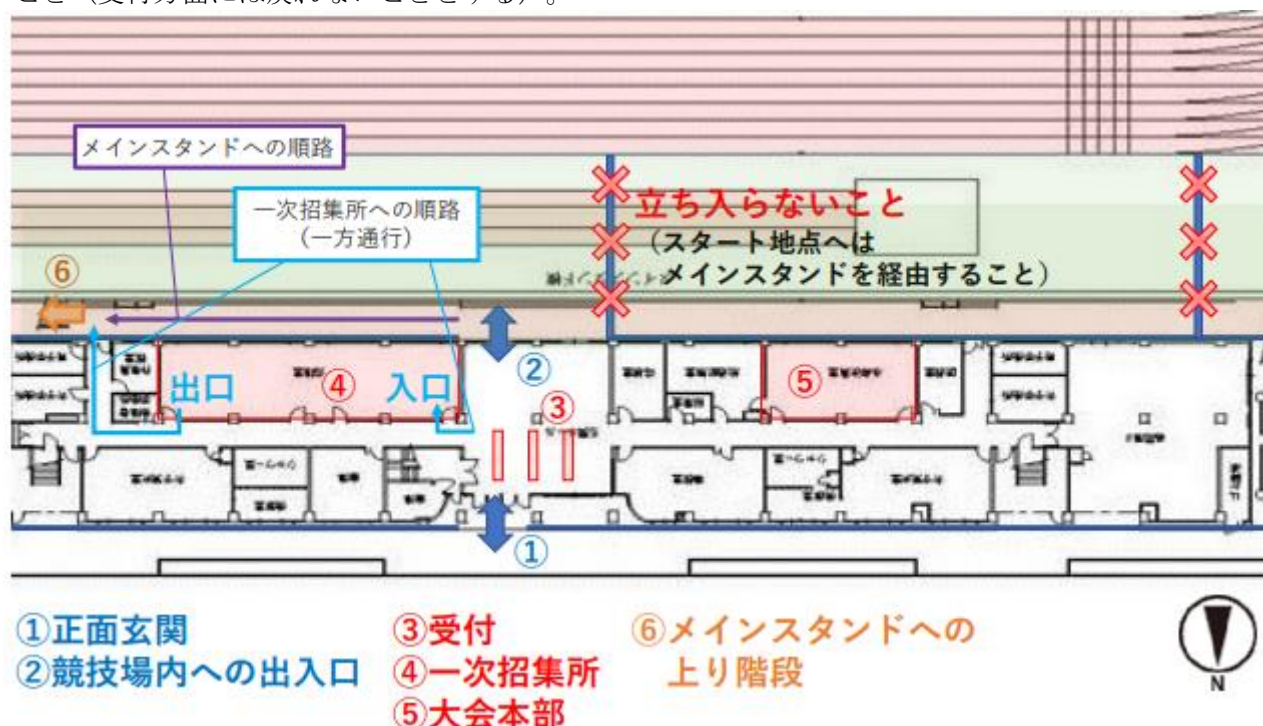
図1 競技場案内図（正面建物1階）